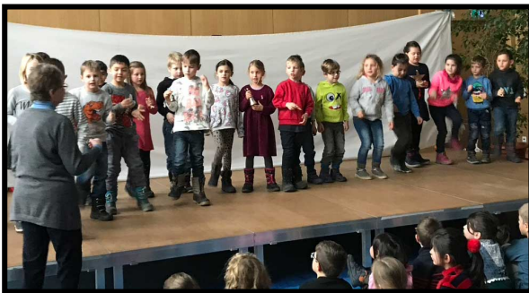
„I hear them“ (2d)