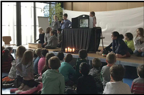
„Simon`s Four Candles“ (2a)