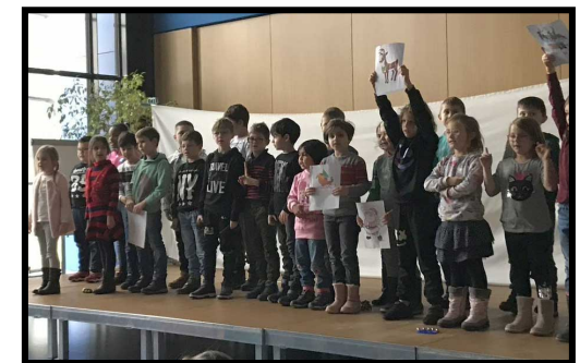
„Up on the housetop“ (2d)