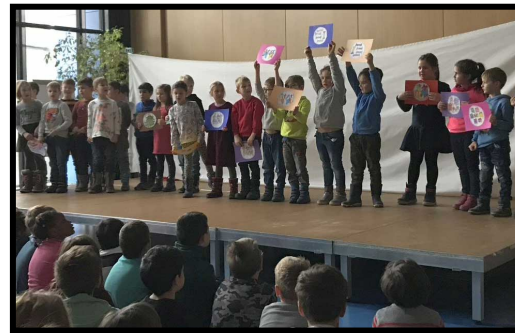
„What can Father Christmas see?“ (1a)